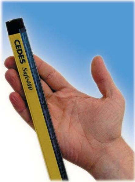
Safe400 - kompakt und flexibel

Safe400-Lichtvorhänge sind berührungslos wirkende Schutzeinrichtungen (BWS). Sie überwachen die Gefahrenbereiche von Maschinen und Anlagen und schützen so Mensch und Material vor Verletzungen bzw. Beschädigungen. Für die Auflösung stehen die Werte 14 mm für Finger- und 30 mm für Handschutz zur Verfügung. Das Sicherheitslichtgitter Safe400 zeichnet sich einerseits durch die extrem kompakte Bauform aus. Andererseits bieten sich in Kombination mit einem CEDES Sicherheitsrelais vom Typ SafeC 200 oder SafeC 400 fast beliebig viele Anpassungsmöglichkeiten an die unterschiedlichsten Anforderungen. Hervorzuheben ist dabei die Möglichkeit neben der reinen Sicherheitsüberwachung die gleichzeitige Längenmessung von Objekten durchzuführen! Die hohen Erfassungsgeschwindigkeiten sorgen für einen schnellen und zuverlässigen Betrieb von Maschine und Anlage.